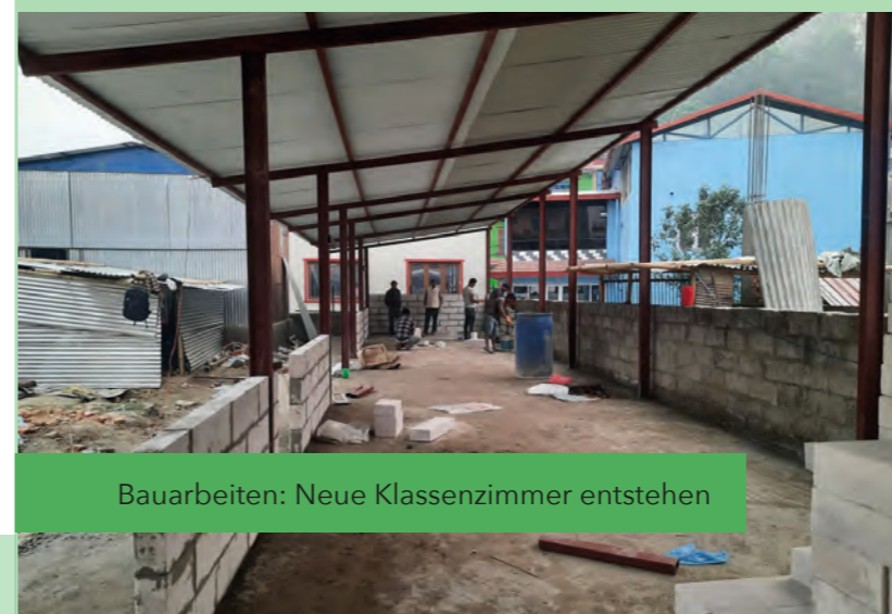
Bauarbeiten: Neue Klassenzimmer entstehen