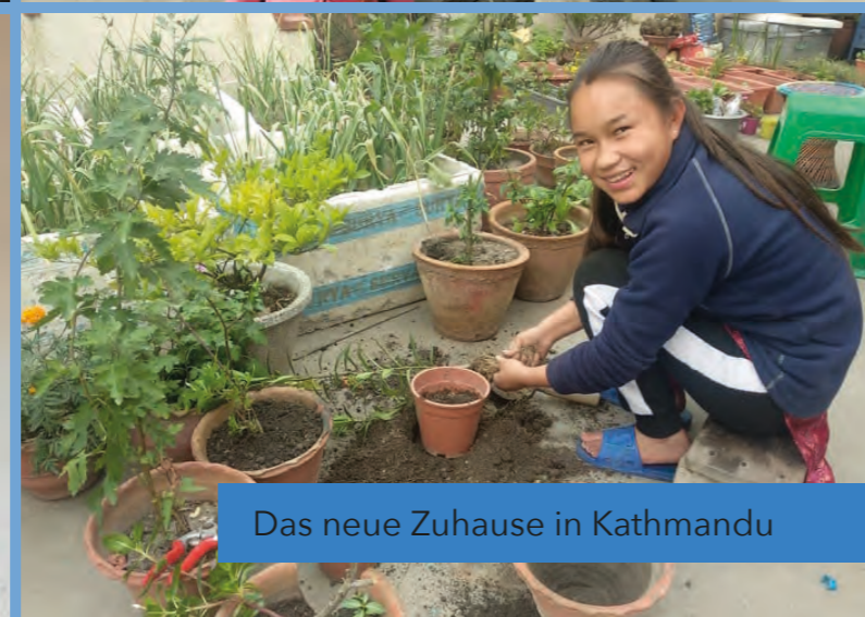
Das neue Zuhause in Kathmandu