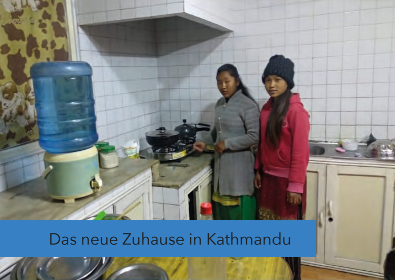
Das neue Zuhause in Kathmandu