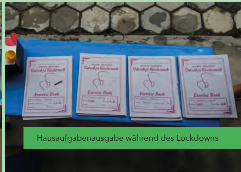
Hausaufgabenabgabe während des Lockdowns