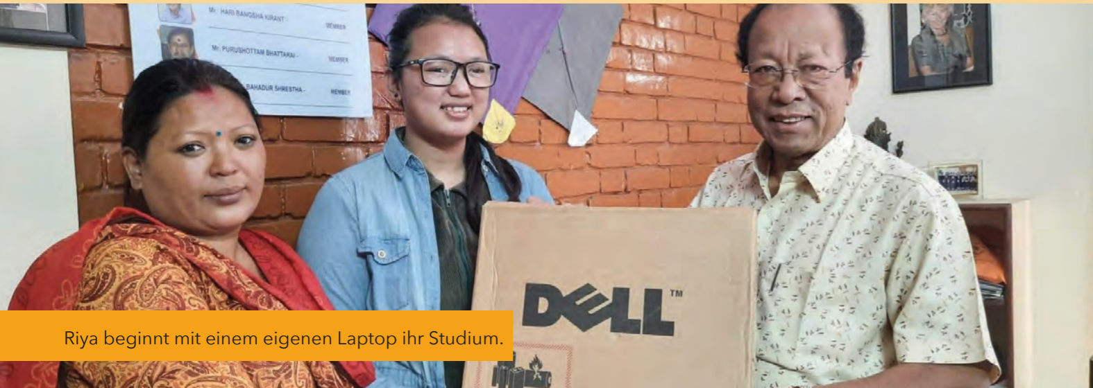
Riya beginnt mit einem eigenen Laptop ihr Studium.