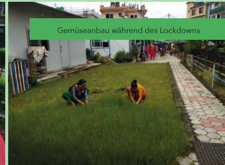
Gemüseanbau während des Lockdowns