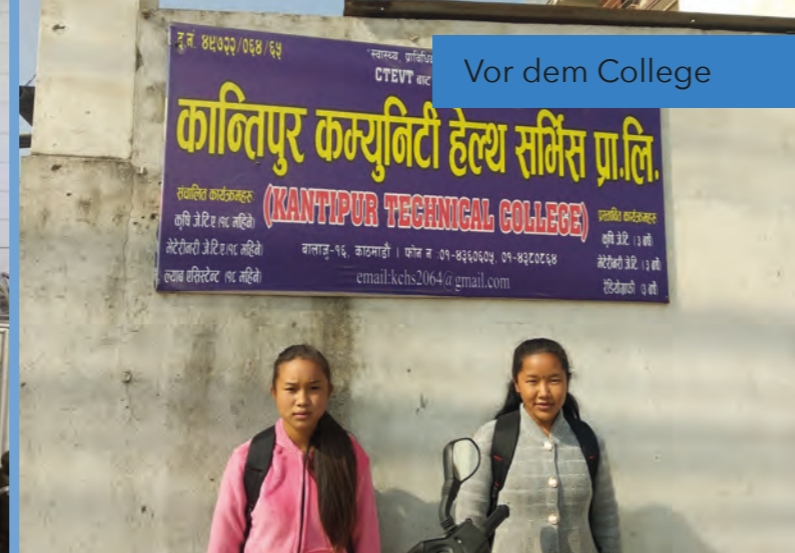
Vor dem College